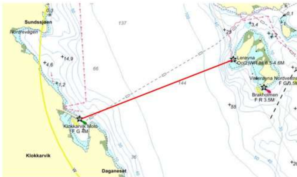
Kartskisse B – målområde med inntegnet mållinje

8.3.2 Det er ønskelig at båtene tar kontakt med måltaker på tlf 99528724 og/eller kanal VHF 69 ca 15 min før målgang.