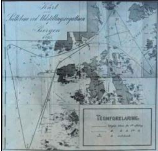
Fra BS jubileumsregatta

Bergens Seilforening ønsker velkommen til Høcom Bergen Singlehanded lørdag 11. september 2021 kl. 11.00 . Startområdet er syd/øst for Bjelkarøy/nord i Korsfjorden og det seiles etter NOR Rating ("tid på tid") med shorthanded rating, eller i klassen NoRating uten målebrev eller utregnet korrigeret tid. For NOR-Rating klasser vil det være anledning til å melde seg på i klasse med eller uten spinnaker. Nærmere klasseinndeling vil avhenge av antall deltagere og fremgår av startlistene.